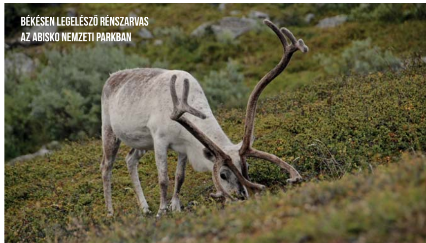
BÉKÉSEN LEGELÉSZŐ RÉNSZARVAS AZ ABISKO NEMZETI PARKBAN

A nemzeti parkok szimbolikus értelmezési lehetőségét azok az országok is hamar felismerték, amelyek a 19. század végének és a 20. század elejének „nyertesei” voltak, és szükségük volt az új identitás minél sokoldalúbb támogatására. Egyes országok új uniót teremtettek (Olaszország, Jugoszlávia), mások függetlenné váltak (Görögország, Lengyelország, Izland, Írország), vagy jelentős új területekkel gyarapodtak (Románia). Mind létre is hozták a maguk nemzeti parkját a két világháború közti, forrongó Európában!