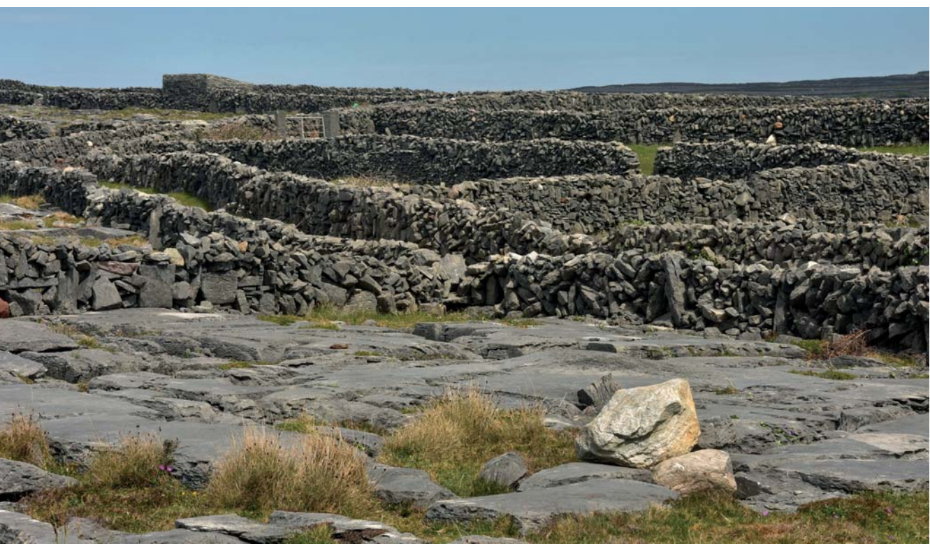
◀ KERÍTÉS-PANORÁMA INISHMORE-ON 1 KM 2 -RE ÁTLAGOSAN 33 KM KERÍTÉS JUT. KÖZTÜK PEDIG A KOPÁR KARRKÖVEZET VAGY NÉHOL EGY KIS FŰ

A kerítések némelyike még a kőkorszaki ember munkája, de a történelem során mindvégig rakták itt egymásra a köveket. A kerítésépítők legfontosabb célja az volt, hogy a köveket elpakolják a soványka földekről, lehetővé téve a gazdálkodást.