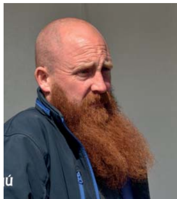
SZÉLBEN EDZŐDVE VÖRÖS SZAKÁLLÚ TENGERÉSZ AZ ARAN-SZIGETEK FELÉ TARTÓ HAJÓN

A néhány házból álló kikötői települést elhagyva végre megpillantjuk a szigetek igazi arcát: akasztásra (vagy másra) alkalmas fát, dús növényzetet itt se