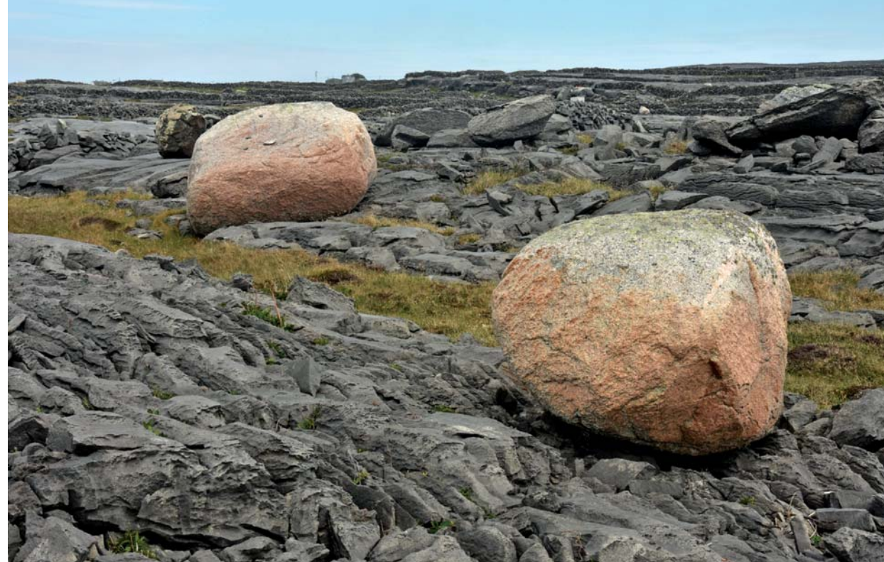
IDEGEN TESTEK RÓZSASZÍN GRÁNITGYAPJÚSZÁKOK A SZÜRKE MÉSZKÖVÖN. A GLECCSEREK CIPELTÉK EZEKET INISHMORE SZIGETÉRE

Írorszában szinte mindenhol gyakoriak a kőkerítések, de itt egészen hihetetlen mennyiségben vannak jelen – a három sziget 46 km 2 -én összesen 1500 km kerítés húzódik.