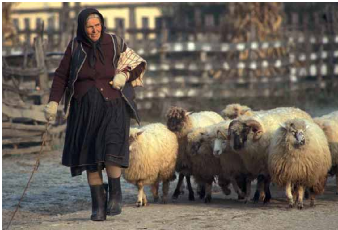
MEGYEN AZ NYÁJ A fizetett pásztorok nagyobb nyájakat terelnek, ám az idősebbek gyakran a maguk néhány birkáját gondozzák nap mint nap (balra)