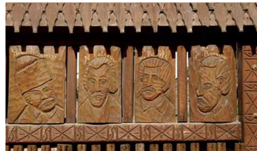
PETŐFI ÉS A HÁROM ROMÁN a horeai faluház kerítésén. Rejtély, hogy Petőfi hogy került ide. De ha már itt van, elsőként románra fordított verse szépen illik a tájhoz: „Lennék én folyóvíz, / Hegyi folyam árja, / Ki darabos utját / Sziklák között járja...”